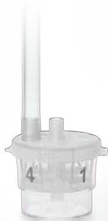
TrapEase™ Polyp Traps